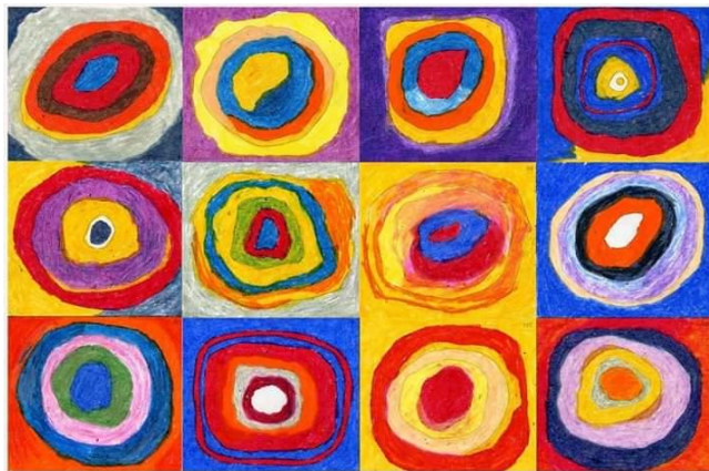
Estudio de color con cuadros. 1913.

Después de observar las dos imágenes, sugiero que busquen otras imágenes en google www.imagenesdeobrasdeKandinsky . Para que puedan tener varias opciones a la hora de realizar las producciones artísticas.