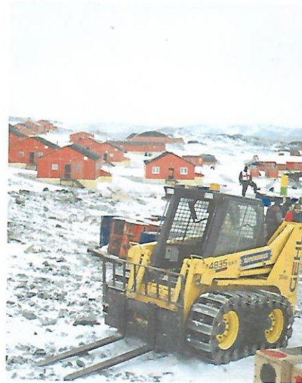
Vista de la Base Esperanza, en el sector de la Antártida Argentina. Si bien ningún país ejerce soberanía sobre el continente antártico, la Argentina reclama como propio el sector comprendido entre los meridianos de 25° y 74° longitud Oeste, el Polo Sur y el paralelo de 60° latitud Sur.